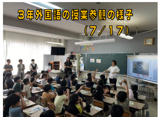
3年外国語の授業参観の様子 (7/17)

また、今年度前期の「学校評価保護者アンケート(7/16~7/23)」のご協力につきましても重ねてお礼申し上げます。ありがとうございました。ご回答いただいた結果につきましては、今後の教育活動の参考にさせていただきます。