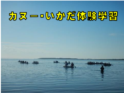
カヌー・いかだ体験学習

宿泊施設はサロマ湖畔にある「ネパール北見」です。体験学習は「カヌー・いかだ体験」「フォトラリー体験」を行ってきました。また、公共施設でのマナーやルール、団体行動や班行動を通して仲間への思いやりや気遣い等の大切さも学ぶことができました。来年は修学旅行があります。自ら考え・判断し・行動することがより求められます。宿泊研修の経験を忘れずに生かしてくれることを期待しています。