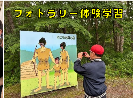
フォトラリー体験学習